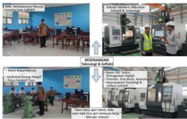
Gambar 3.2. Mesin Produksi Modern di Industri Mitra

yang menuntut keterampilan pemrograman digital, sementara di sekolah siswa masih terbiasa menggunakan mesin bubut manual yang mengandalkan keterampilan tangan. Kesenjangan ini menyebabkan industri harus menginvestasikan waktu dan biaya tambahan untuk pelatihan dasar yang seharusnya sudah menjadi bekal dari sekolah.