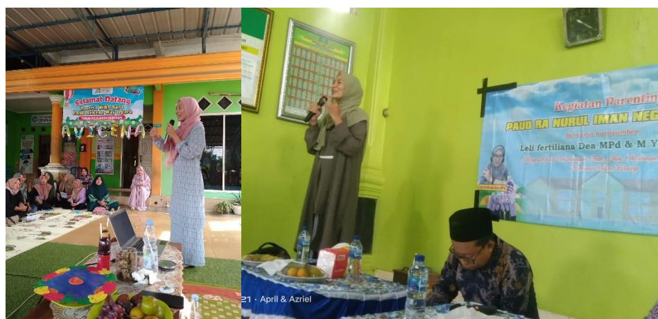
Gambar 1. Penyampaian Materi Parenting di PAUD

Tahap refleksi bersama antara guru dan orang tua menjadi momen penting dalam program ini. Dalam forum refleksi, orang tua saling berbagi pengalaman dan tantangan selama menerapkan pola asuh positif di rumah. Banyak orang tua yang mengaku lebih sabar dan memahami karakter anak setelah mengikuti kegiatan ini. Guru pun merasa terbantu karena komunikasi dengan orang tua menjadi lebih terbuka dan terarah, sehingga proses pendidikan berjalan lebih harmonis.